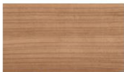
Kirschbaum Caffè quer