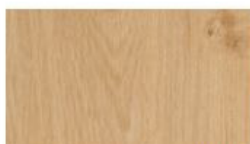
Eiche Crema Rustikal*