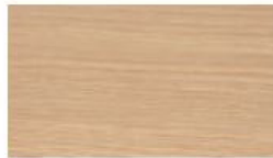
Eiche Crema quer